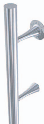
ANYDG. 7 (R)