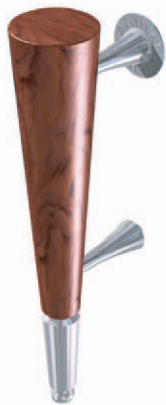
ANYDG. 1 (H+R / H+A)

Vous trouverez ci-dessous un aperçu de la gamme exclusive de poignées. En fonction du type, celles-ci sont proposées en aluminium anodisé, en acier inoxydable ou dans un bois dur exotique. Pour certains modèles, il est possible de combiner ces matériaux. Ces poignées de porte sont fixées sur le panneau de porte à l'aide de deux tiges filetées étant donné que pour les portes ANYWAY, aucun mécanisme de serrure ou de pêne de jour n'est présent. Pousser ou tirer suffit. La tige inférieure est montée dans la version standard à une hauteur de centrage de 1.000mm, tandis que la tige supérieure est montée à 1.125mm et à 65mm du bord du panneau de porte. Outre les poignées de porte sur des écarteurs en acier inoxydable, il existe également plusieurs modèles qui sont collés structurellement sur le panneau de porte et résistent aux UV et à l'humidité. Également à une hauteur de centrage de 1.000mm et à 65mm du bord du panneau de porte.