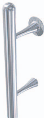
ANYDG. 6 (R)