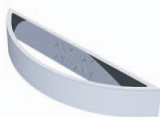
ANYDG. 9 (SB)