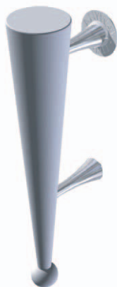
ANYDG. 2 (H / A / R)