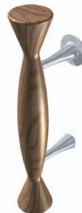
ANYDG. 4 (H / A / R)