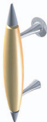
ANYDG. 5 (H / A / R)